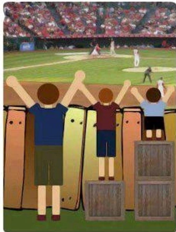
'Iedereen zo behandelen dat de mogelijkheden gelijk zijn'