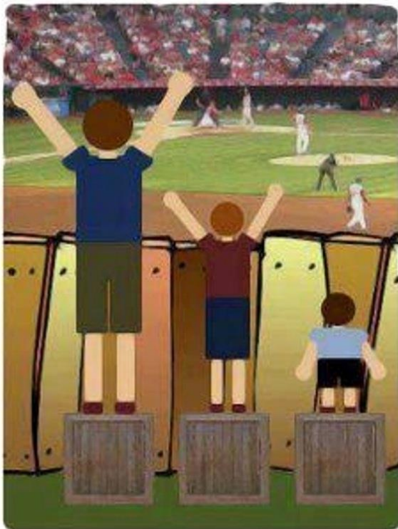
'Iedereen gelijk behandelen'

Landen die het VN-verdrag hebben geratificeerd, hoeven niet alles in één keer op orde te hebben. Zij moeten aan een internationaal mensenrechtencomité laten zien welke stappen ze zetten. Dit comité beoordeelt of de voortgang voldoende is. De maatregelen moeten bovendien redelijk zijn. Dat betekent dat zij niet mogen leiden tot onevenredige of onnodige overlast voor anderen. Kijken hoe we met elkaar drempels in de samenleving kunnen wegnemen is meestal een goed begin. Vaak kan dat al met hele kleine aanpassingen. Als je samen op zoek gaat naar die oplossing, dan kom je er meestal wel uit.